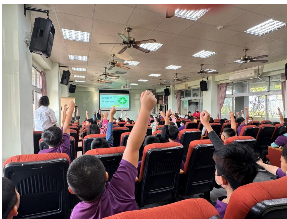
指導學生正確資源回收，加強宣導垃圾分類。